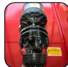
Clutch que brinda mayor seguridad.