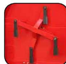
4 navajas de acero templado especial de doble filo con ángulo apropiado de corte.