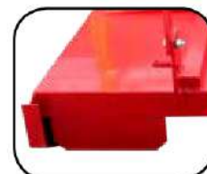
Cortinas de metal que evitan que el material salga proyectado.