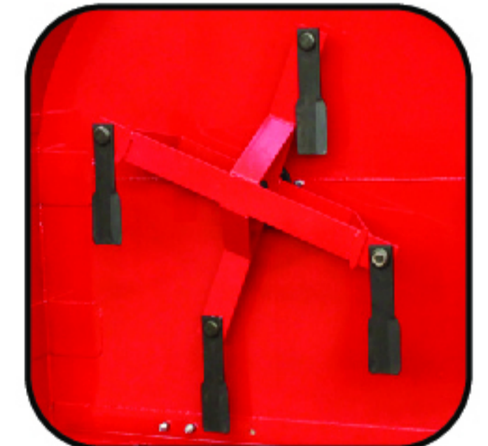
4 navajas de acero templado especial de doble filo con ángulo apropiado de corte.