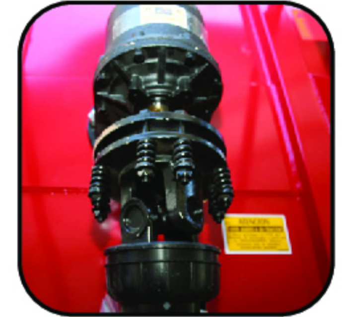
Clutch que brinda mayor seguridad.