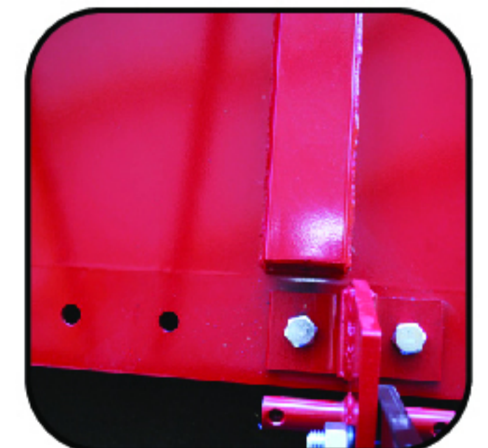
Huecos para descentrar el equipo y hacer cortes laterales.

Ajustable a diversas posiciones para la altura de corte.